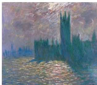
Claude Monet – Londres. Le Parlement. Reflets sur la Tamise, 1905 – Huile sur toile, 81×92cm – Paris, musée Marmottan Monet, inv. 5007