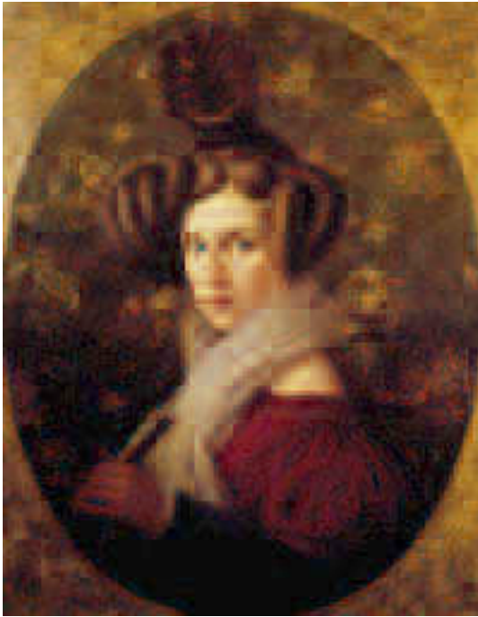
Margherita Barezzi. Porträt von A. Mussini. – Verdis erste Frau war die älteste Tochter Antonio Barezzis. Sie studierte Gesang und wurde zur Musiklehrerin ausgebildet.

zwei Monate später heiratete er Margherita Barezzi. Wenn sein Schwiegervater auch für eine komfortable Wohnung sorgte, stellten sich doch Geldsorgen ein, da Verdis Gehalt so niedrig war, dass er Schulden machen musste. So wuchsen die Sorgen für ihn und seine Frau noch, als im März 1837 ihre Tochter Virginia und im Sommer des nächsten Jahres ihr Sohn Icilio Romano geboren wurden. Ihre Namen erhielten die Kinder nach den Helden aus dem Freiheitsdrama «Virginia» von Vittorio Alfieri. 7 In seinen politischen Vorstellungen war Verdi von Mitgliedern der Mailänder philharmonischen Gesellschaft bestärkt worden, Gegnern der österreichischen Fremdherrschaft, die auf ein vereintes Italien hofften, auf ein unabhängiges «Vaterland» Italien, wie es bei Alfieri hieß. Da seit dem Wiener Kongress große Teile des Landes zu Habsburg gehörten oder