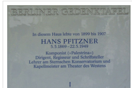
Berliner Gedenktafel in Berlin-Wilmersdorf, Durlacher Straße 25