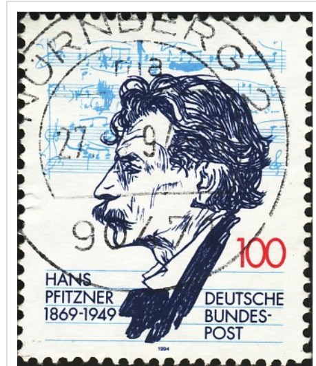
Briefmarke der Deutschen Bundespost, 1994.