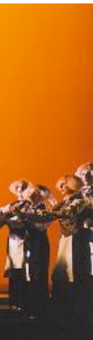
Szenenfoto einer Aufführung von «Un giorno di regno» an der Wiener Volksoper 1995/96. – Nach dem Misserfolg dieser Buffa 1840 spotteten die Mailänder: «König für einen Tag? Nicht einmal für eine Stunde!»

fiore in der Rolle des polnischen Königs Stanislas 11 setzt ein allgemeines Verstellungsspiel in Gang, dessen Verwirrungen, am Ende außer Kontrolle geraten, erst durch den Deus ex machina, einen Brief des echten Königs, gelöst werden. Mit dem Duett zwischen Baron und Schatzmeister, die sich über die Modalitäten ihres Duells nicht einigen können, gelang eine Persiflage auf Männerrituale und Imponiergehabe. Wirkungsvoll ist auch die Gleichzeitigkeit von lyrischem Gesang des Liebespaares und dem Buffogeplapper der militärischen Strategen im Sextett, ebenso die Cabaletta der Marchesa ( Se dee cader la vedova ) in ihrer federnden Leichtigkeit. Indes, all das war auch schon ein wenig veraltet. Keine Opera buffa wollte das Publikum mehr hören, man verlangte nach dem neuen Ton des «romanticismo», nach extremen Gefühlen und Leidenschaften, wie sie die Protagonistinnen in «Norma», «La sonnambula» und «Lucia di Lammermoor» vorgeführt hatten. Da überdies die Sänger weder Lust noch Talent zur Buffa zeigten, wurde die Premiere ein Fiasko. Mit Pfiffen und Gebrüll attackierten die Zuschauer den Komponisten, der, wie es damals üblich war, im Orchester der Aufführung zuhörte. Eine Zeit lang scheint Verdi wie betäubt gewesen zu sein, so dass er, wie er seinem Verleger später erzählte, nur noch fähig war, Schundromane zu lesen.